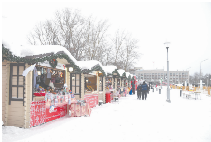
◆ Под прицелом камер системы «Безопасный город» — основные площади, скверы, большие перекрестки.

Доступ к уличным камерам в Череповце временно ограничен. В мэрии объясняют это техническим обновлением портала и особым режимом безопасности для объектов критической инфраструктуры. Вместе с тем дорожных камер в регионе стало заметно больше.