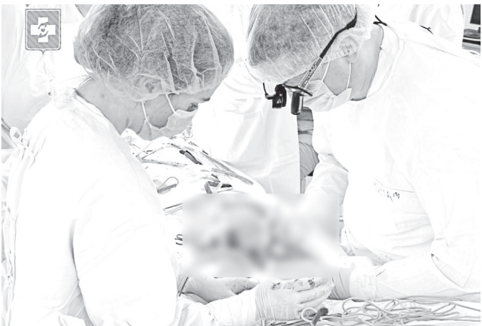
◆ В этом году в ВОКБ уже трем пациентам были сделаны сложные операции на открытом сердце.