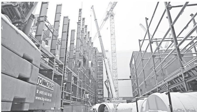
◆ В этом году компания концентрирует усилия на завершении ключевых проектов.