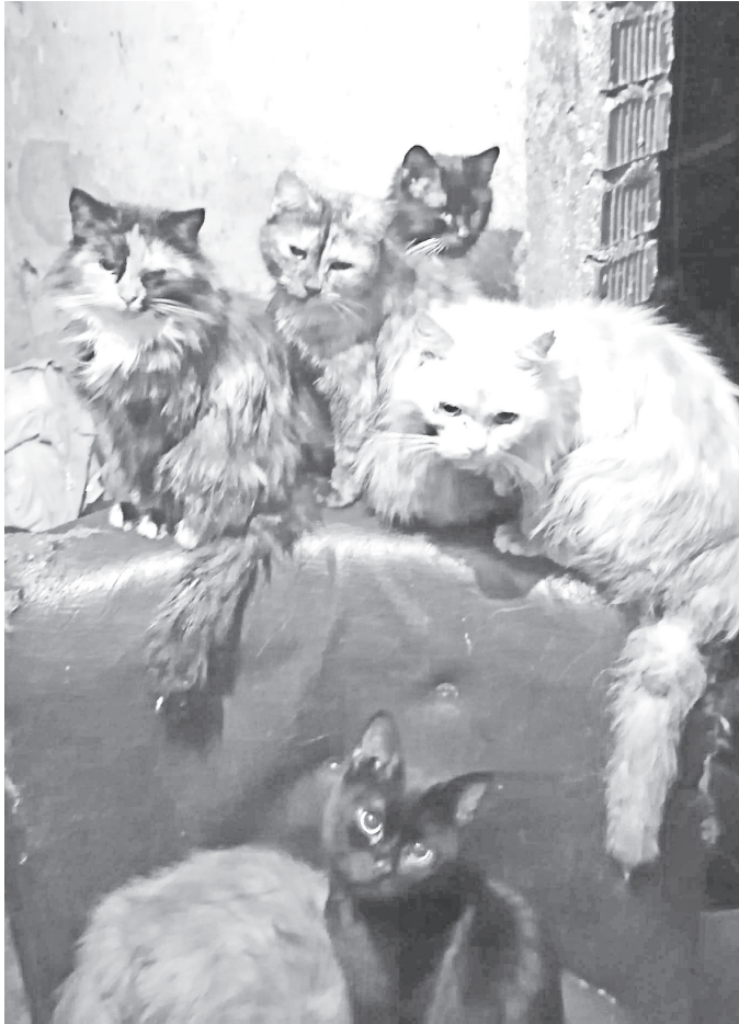
◆ У прежних владельцев еще осталось семь кошек; чтобы их забрать, нужны передержки.