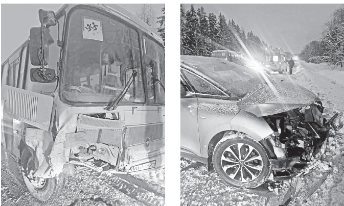
◆ Под Вологодой водитель «Рено» не уступил дорогу школьному автобусу и врезался в него.