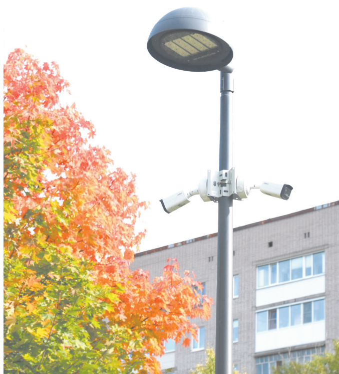
◆ Назвать точное количество уличных камер в администрации города нам так и не смогли.

Технологии. А на дорогах Вологодчины стало на 200 камер видеонаблюдения больше