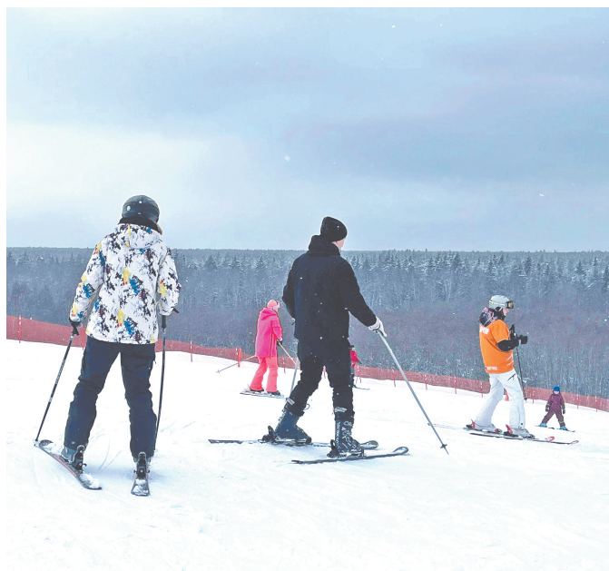
Реконструкцию склонов планируют начать весной, чтобы продлить текущий зимний сезон.

Развитие. Снежные пушки позволят продлить горнолыжный сезон