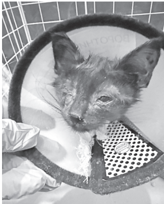
◆ Спасенные животные находятся в плачевном состоянии: они больны, истощены и напуганы.