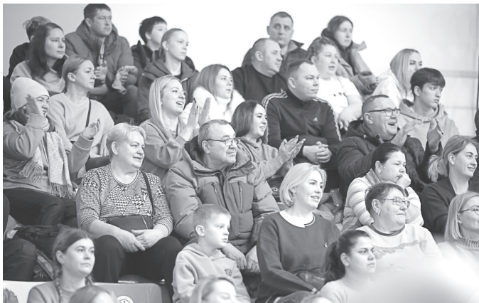
◆ «Праздник волейбольного мяча» собрал в СК «Юбилейный» сотни детей и их родителей. Мероприятие проходит с 2011 года и пользуется большой популярностью.