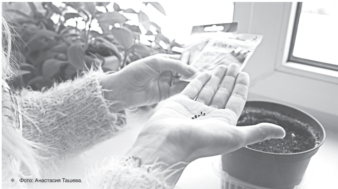
♦ Фото: Анастасия Ташева.