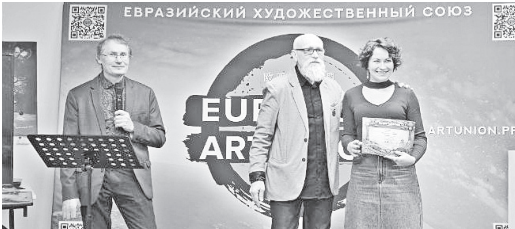
◆ Череповецкий фотограф Анастасия Петрович стала призером международного конкурса в Китае за работу, посвященную ярославской художнице. Снимок выставлялся в Пекине.