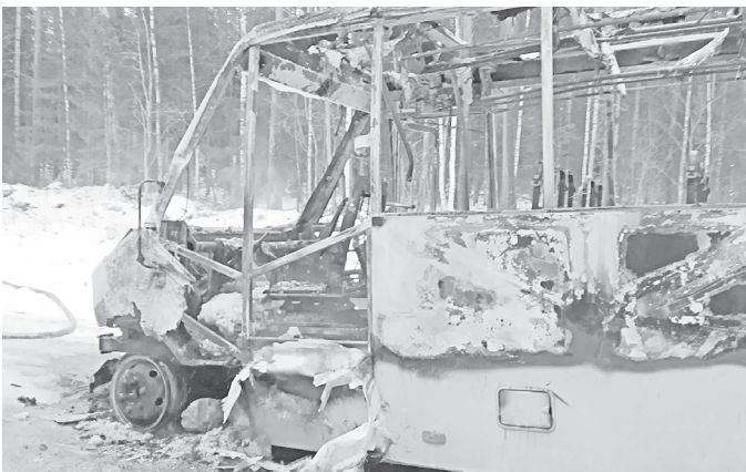
◆ В Бабушкинском округе сгорел школьный автобус.