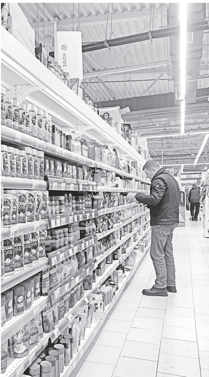
♦ В начале 2022 года килограмм зернового кофе можно было купить за 1136 рублей, а в ноябре 2025-го — за 2061 рубль.

приемлемой для них суммы. Поэтому многие россияне стали ограничивать себя в привычном напитке. Но и совсем отказываться от кофе наши потребители не готовы. По данным ассоциации «Росчайкофе», еще пять-семь лет назад кофе стал основным горячим напитком россиян, потеснив прежнего традиционного лидера — чай. Продажи которого, по информации компании «Нильсен», снизились только в 2025-м на 3 %. Поэтому, скорее всего, нас ожидает внутренняя трансформация отечественного кофейного рынка. Главными пострадавшими, вероятно, окажутся кофейни, особенно несетевые. Граждане все чаще предпочитают варить напиток дома, что подтверждает статистика маркетплейсов, которые фиксируют рост продаж кофеварок и кофемашин — на 7–30 % за последний год. Есть причины переживать и у традиционной розницы: зерновой, молотый и растворимый кофе россияне стали активно покупать не в магазинах и супермаркетах, а на тех же маркетплейсах — из-за более доступной цены. Да вот еще и кражи с прилавков растут, с чего мы, собственно, и начинали.