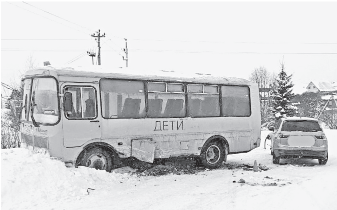
◆ В Вологодском округе водитель врезался в школьный автобус.