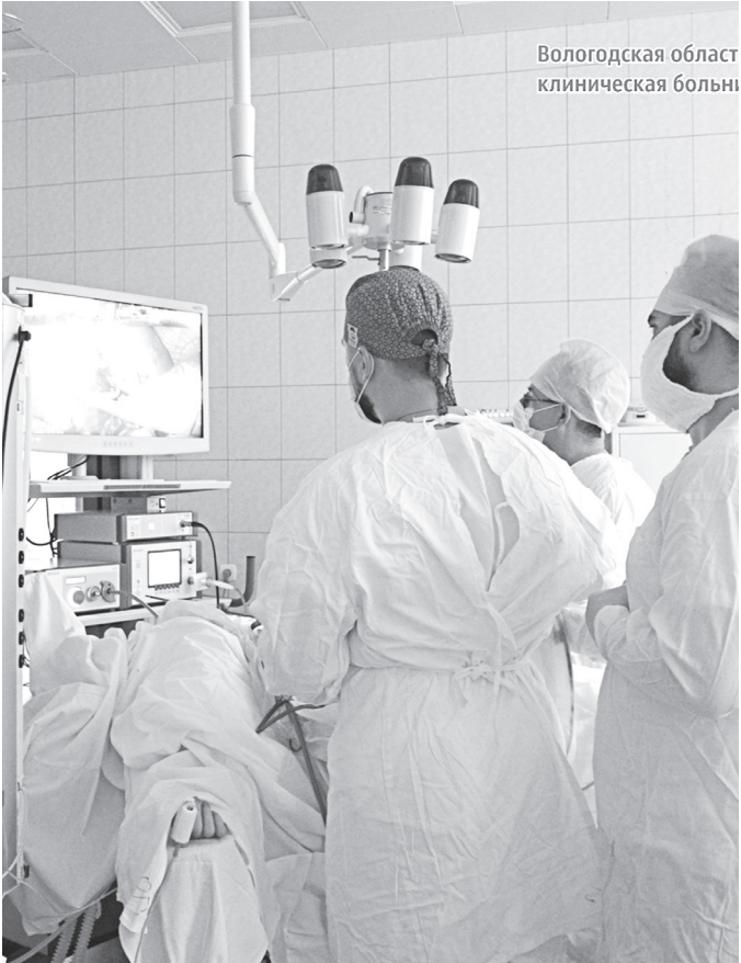
◆ Череповецкие хирурги успешно выполнили первую в области операцию по удалению селезенки через проколы.